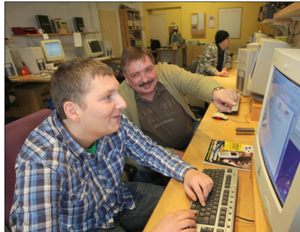
Kreatives Gestalten in der CD-Repro

Die tägliche Arbeitszeit beträgt 4 Stunden und kann im 3. Modul auf 6 Stunden erhöht werden.