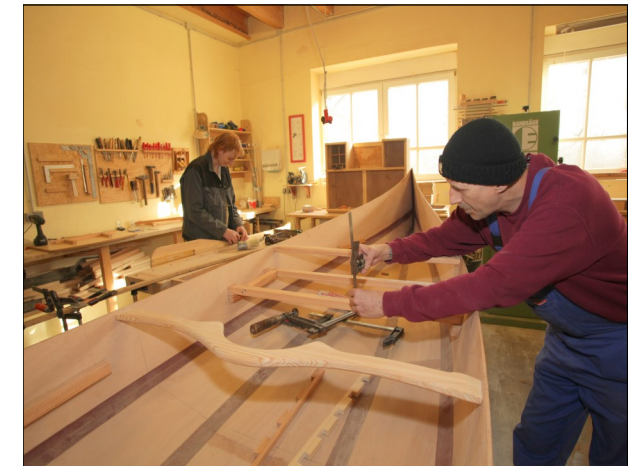
Handwerkliche Fähigkeiten entwickeln